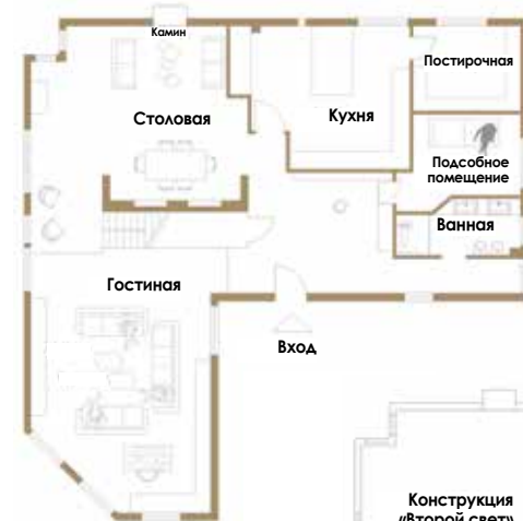
План 1-го этажа виллы в окрестностях города Терни (Умбрия)

Высокие потолки – преимущество виллы. Они позволили установить в гостиной большую библиотеку