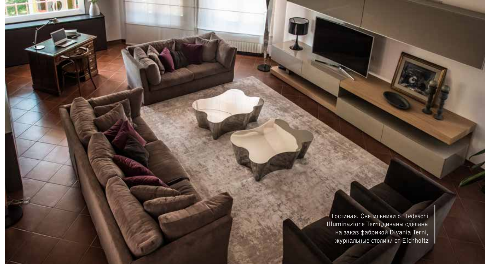
Гостиная. Светильники от Tedeschi Illuminazione Terni, диваны сделаны на заказ фабрикой Divania Terni, журнальные столики от Eichholtz

Высокие потолки – преимущество виллы. Они позволили установить в гостиной большую библиотеку