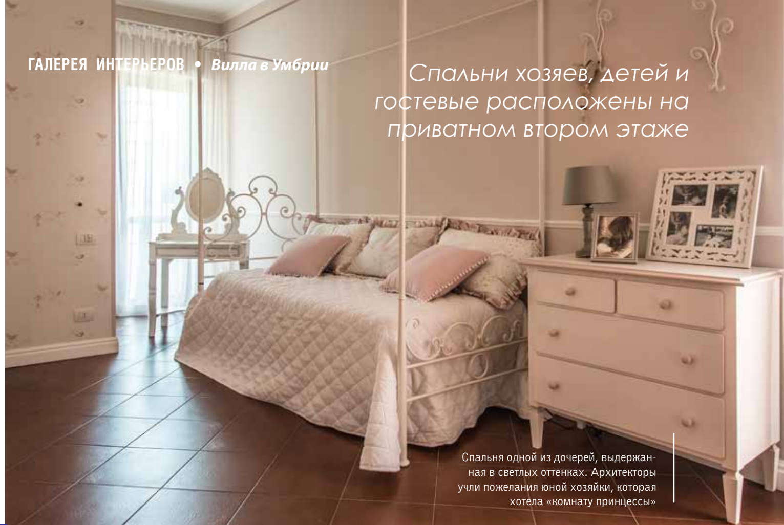
Спальня одной из дочерей, выдержанная в светлых оттенках. Архитекторы учли пожелания юной хозяйки, которая хотела «комнату принцессы»

Спальни хозяев, детей и гостевые расположены на приватном втором этаже