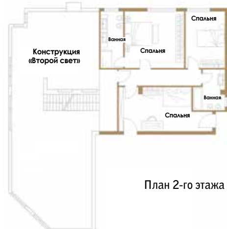
План 2-го этажа