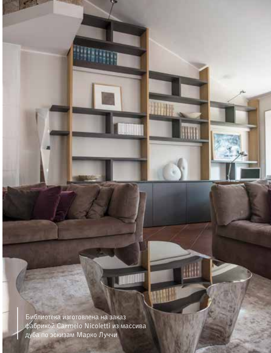
Библиотека изготовлена на заказ фабрикой Carmelo Nicoletti из массива дуба по эскизам Марко Луччи

Общая колористика отличается теплой цветовой палитрой с использованием оттенков серо-коричневого и бежевого; в отделке каждой зоны преобладают натуральные природные материалы, такие как дерево и камень. «Мы хотели создать комфортный, но в то же время персонализированный интерьер для молодой семьи, которая максимально прислушивалась к нашему мнению и вместе с нами разрабатывала многие нюансы», — говорят архитекторы. Это плодотворное сотрудничество воплотилось в каждой детали интерьера, наполненного гармонией цвета и формы. Льняные шторы и бархатные диваны гармонично сочетаются с дизайнерскими стальными элементами, что делает интерьер более современным и создает неожиданную игру света и тени. Многие предметы создавались на заказ, поэтому интерьер получился действительно уникальным. Стена за камином оклеена обоями, на которые вручную, в соответствии с общей колористикой