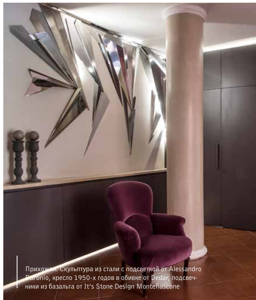
Прихожая. Скульптура из стали с подсветкой от Alessandro Varonio, кресло 1950-х годов в обивке от Dedar, подсветники из базальта от It's Stone Design Montefiascone

Большая библиотека в гостиной изготовлена на фабрике Carmelo Nicoletti, в ней чередуются лакированные и необработанные вставки из натурального дуба. Для достижения более яркого визуального эффекта рядом с библиотекой архитекторы расположили современные торшеры и столики, в которых отражаются картины и деревянные элементы. Диваны были созданы по эскизам архитекторов и изготовлены на заказ компанией Divania. Они идеально вписываются в пространство и придают интерьеру особый комфорт. Высокие технологии, без которых теперь не обходится современный дом, присутствуют и на этой итальянской вилле. Она оборудована системами «умный дом» и видеонаблюдения — для удобства хозяев и защиты от непрошенных гостей. E