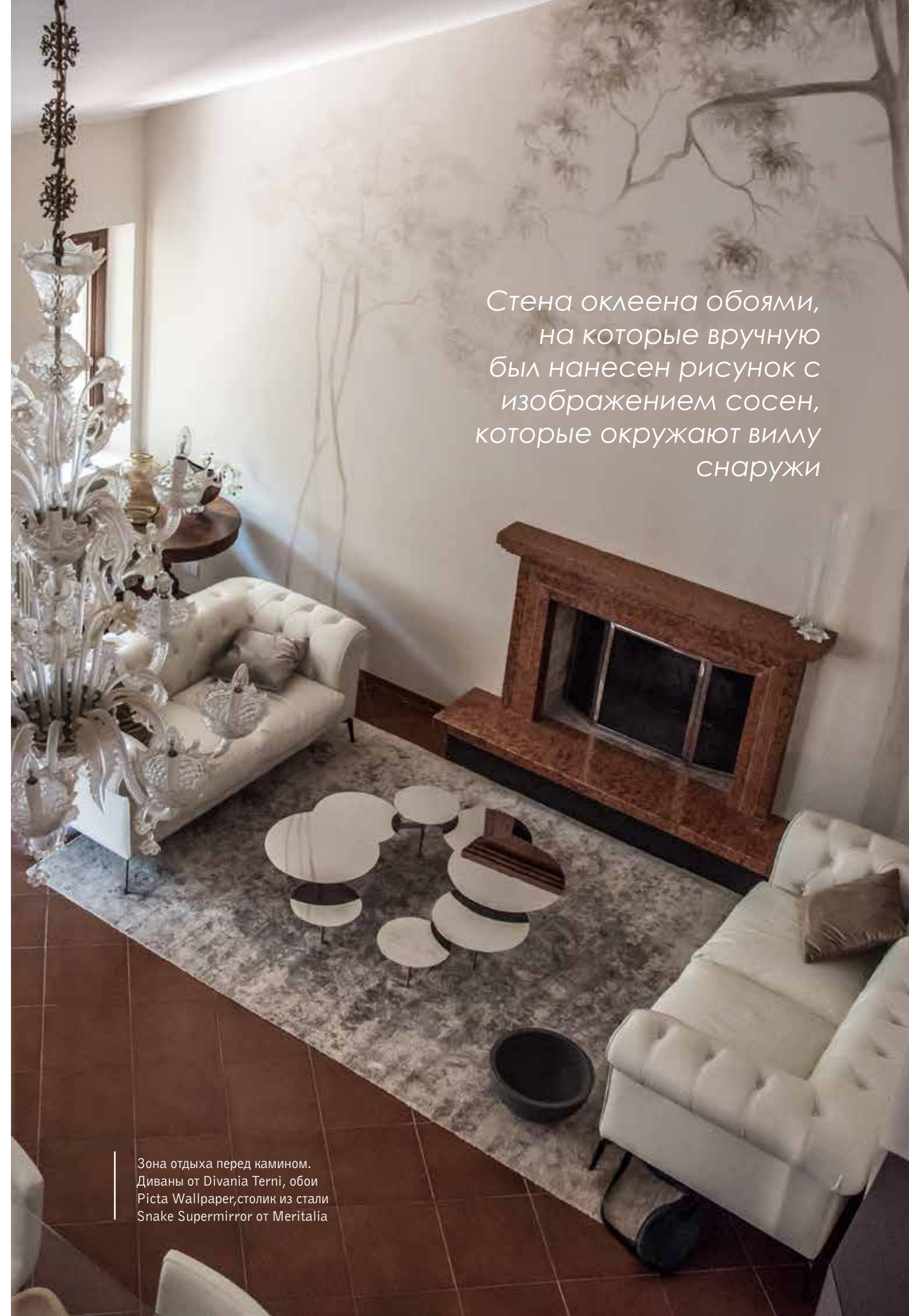
Зона отдыха перед камином. Диваны от Divania Terni, обои Picta Wallpaper, столик из стали Snake Supermirror от Meritalia

Стена оклеена обоями, на которые вручную был нанесен рисунок с изображением сосен, которые окружают виллу снаружи