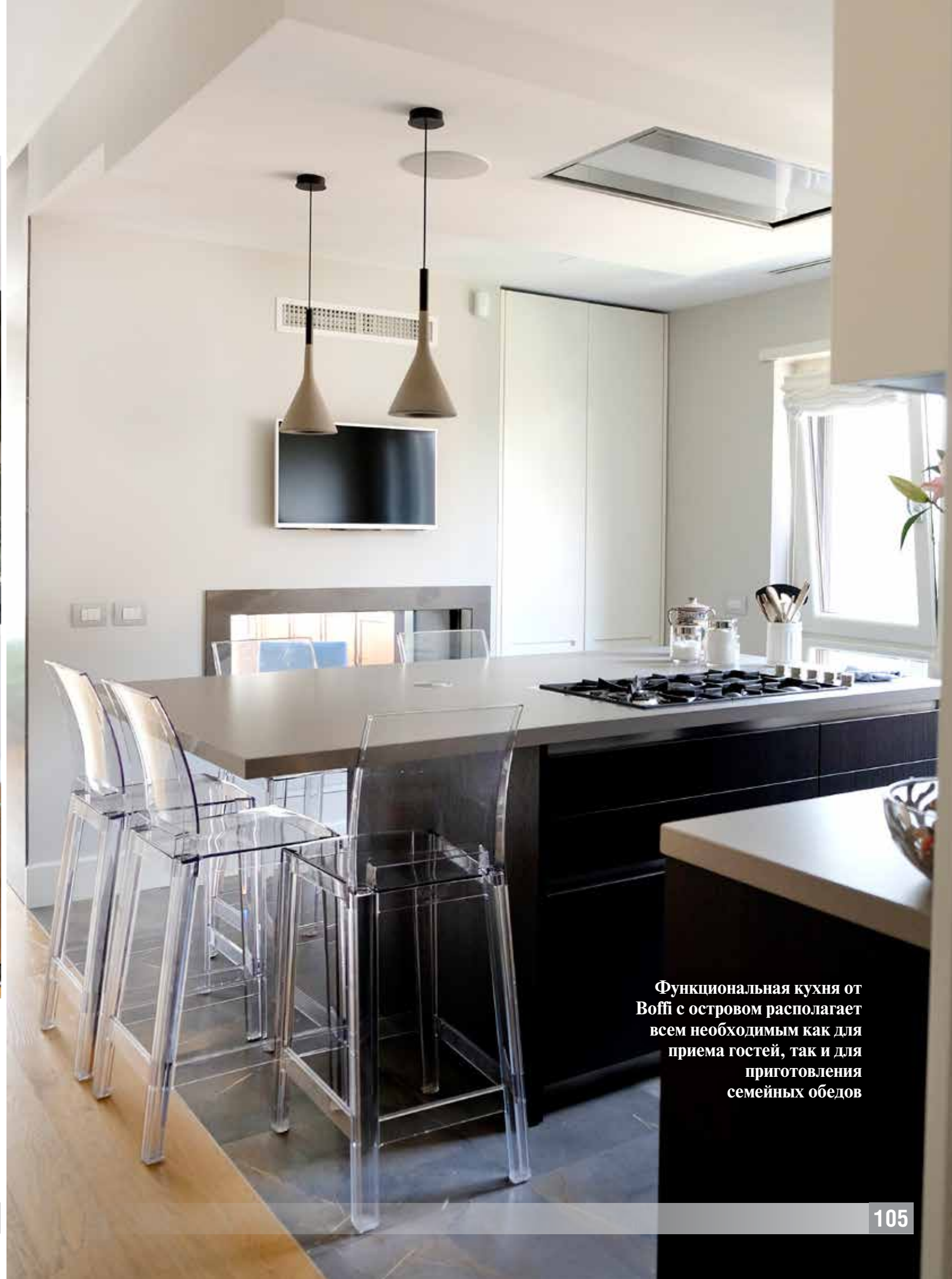
Функциональная кухня от Boffi с островом располагает всем необходимым как для приема гостей, так и для приготовления семейных обедов