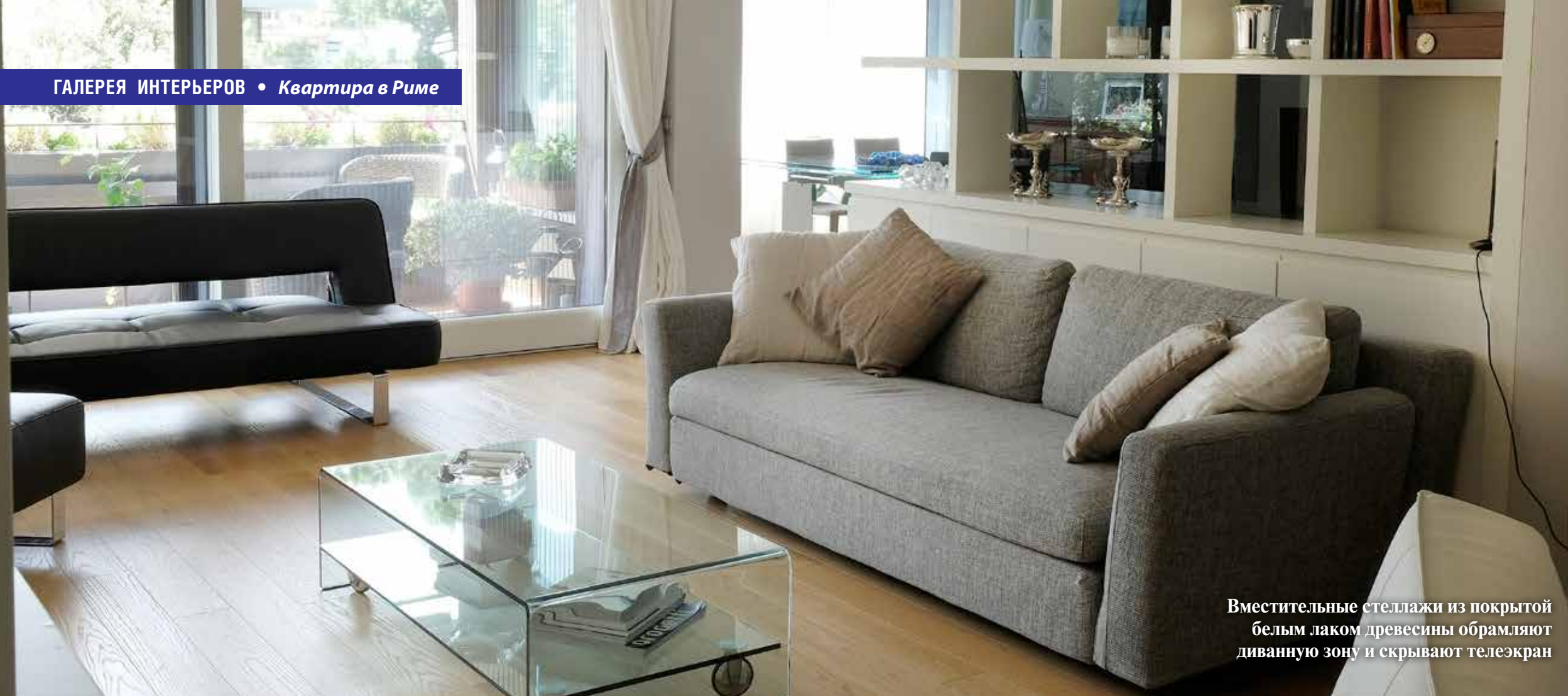
Вместительные стеллажи из покрытой белым лаком древесины обрамляют диванную зону и скрывают телевизор